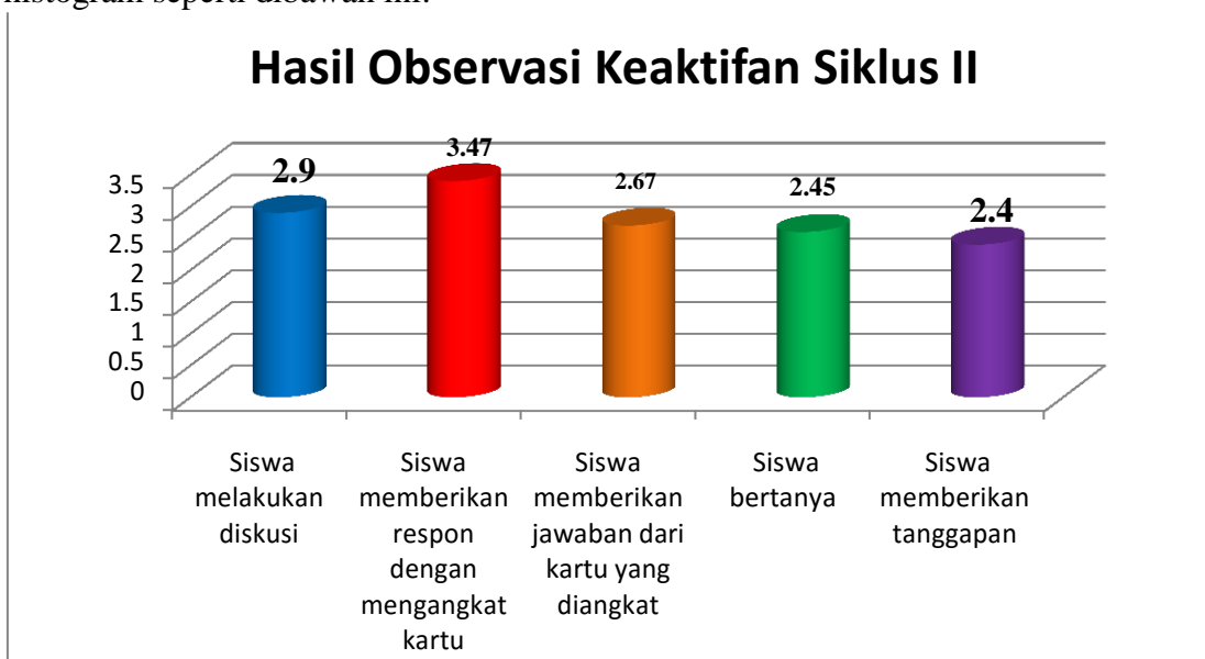
Gambar 4.6 Grafik Keaktifan Siswa Siklus II

Dari tabel 4.3 menunjukkan bahwa keaktifan siswa dalam proses pembelajaran pada siklus II mengalami peningkatan dengan perolehan nilai rata-rata 2,8 dan termasuk kategori baik. Setelah dihitung nilai rata-rata skor pada setiap siklus II, maka dapat digambarkan grafik histogram seperti dibawah ini: