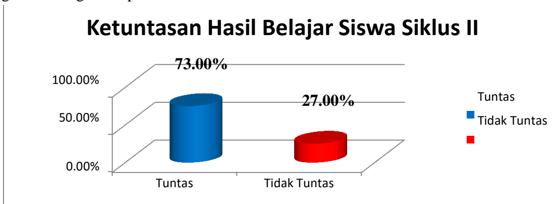
Gambar 4.8 Grafik Persentase Ketuntasan Hasil Belajar pada Siklus II

Setelah dihitung nilai persentase hasil belajar pada siklus II, maka dapat digambarkan grafik histogram seperti dibawah ini: