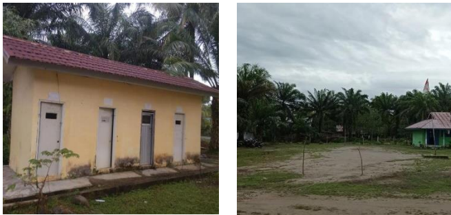
Gambar 1. Keadaan lingkungan sekolah dan Toilet SDN 102 Kota Bengkulu

penulis lakukan di SD Negeri 102 Kota Bengkulu menunjukkan bahwa adanya temuan yang unik yaitu kondisi lingkungan SDN 102 Kota Bengkulu masih terlihat kotor. Banyak ditemukan sampah yang bukan pada tempatnya, toilet siswa juga sangat kotor sehingga mengeluarkan aroma yang tidak sedap dan kurang nyaman saat akan melakukan buang air kecil atau buang air besar. Terlihat pada gambar 1.