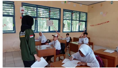
Gambar 3. sosialisasi tentang peran UKS dalam pembinaan sekolah sehat

Pertama, Tahap sosialisasi tentang bagaimana peran UKS dalam pembinaan sekolah sehat di SDN 102 Kota Bengkulu.