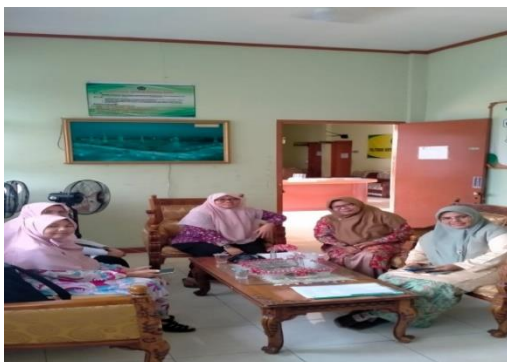
Gambar 1. Pertemuan Tim PkM dengan Kepala Sekolah SMK Pariwisata Aisyiyah Sumatera Barat

Pada tahap persiapan dimulai dari pengurusan surat rekomendasi PkM ke Pimpinan Wilayah Aisyiyah Sumatera Barat, kemudian dilanjutkan dengan koordinasi atau penjajakan dengan mitra dalam hal ini Kepala Sekolah SMK Pariwisata Aisyiyah Sumatera Barat sekaligus meminta kesediaan mitra dalam pelaksanaan kegiatan PkM ini.