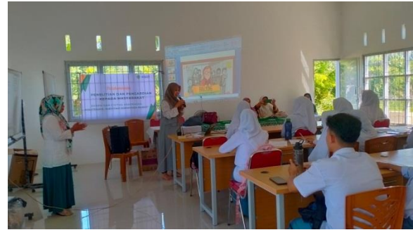
Gambar 5. Siswa/i mengisi Pre Tes Stop Bullying

Kegiatan selanjutnya siswa/i mengisi pre tes Stop Bullying untuk mengetahui dan mengkaji pengetahuan dan sikap siswa/i di sekolah.