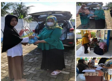
Membuat sudut baca

#tknegeripatumbak #salingberbagi#donaturhebat