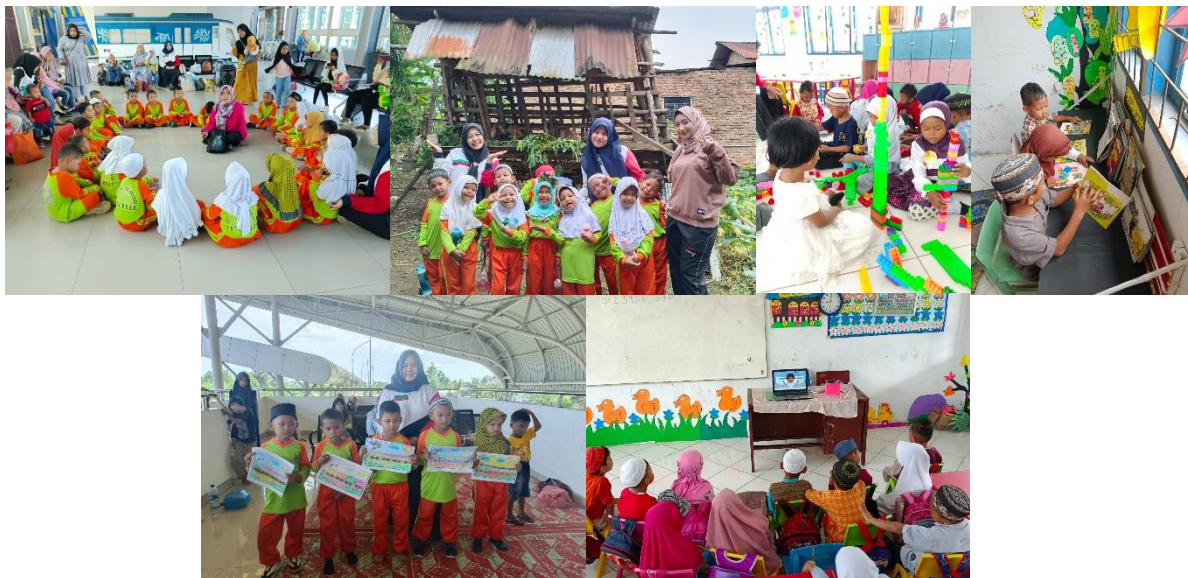
Gambar 3. Pembelajaran Berpusat Pada Anak

Sekolah tidak serta merta lepas tangan, Kepala Sekolah tetap melakukan penilaian kinerja guru di PMM. Dari hasil penilaian tersebut guru bisa melakukan refleksi tentang evaluasi dan bisa melakukan perbaikan-perbaikan yang mana tadinya pembelajaran berpusat pada guru akhirnya berubah berpusat pada siswa.