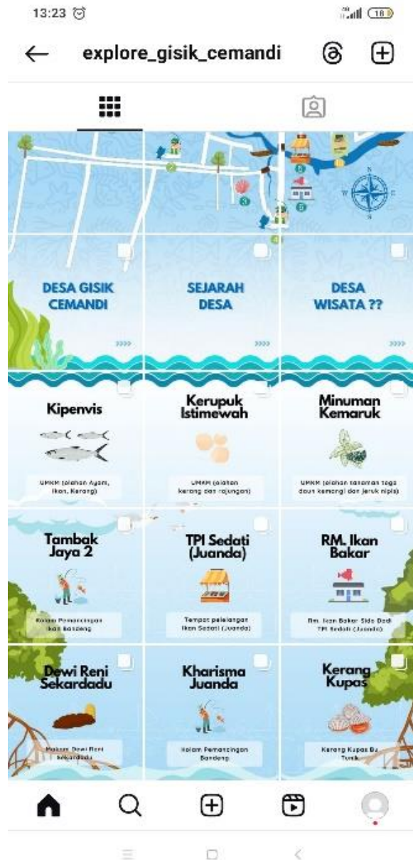
Gambar 3. Feed Instagram