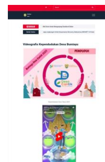
Gambar 3. Videografis Profil Desa Bumiayu Tahun 2023

Adapun hasil kegiatan Desa Cantik yakni ditambahkan menu Desa Cantik pada Website Desa yang khususnya untuk