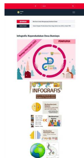
Gambar 2. Infografis Profil Desa Bumiayu Tahun 2023