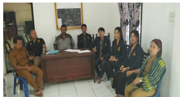
Gambar 3. Diskusi kegiatan bersama Perangkat Desa

Beberapa foto dokumentasi kegiatan yang dilakukan pada PkM ini adalah sebagai berikut: