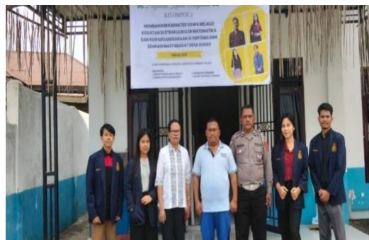
Gambar 1. Perkenalan dengan Kepala Desa dengan Peserta PKM Desa Sugau.

Mengadakan pertemuan dengan kepala desa, dan kepala dusun untuk menjalin kerja sama untuk mendukung keberlangsungan program. Membentuk kelompok kerja yang terdiri dari Peserta PKM, guru, dan tokoh masyarakat guna memastikan pelaksanaan program berjalan dengan baik.