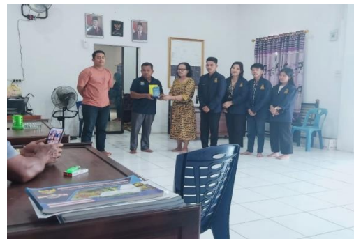
Gambar 9. Penjemputan dan Perpisahan Mahasiswa PKM Di Desa Sugau