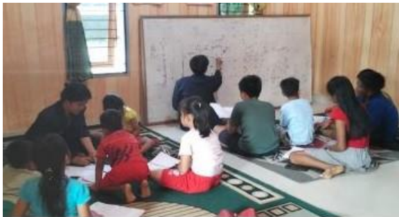
Gambar 5. Bimbingan Belajar di Rumah Penduduk