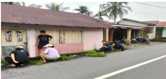
Gambar 6. Kegiatan Gotong Royong Bersama Penduduk Dusun 1.