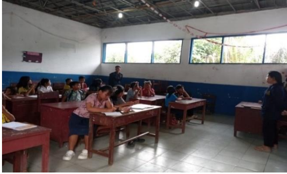
Gambar 4. Bimbingan Belajar di Sekolah