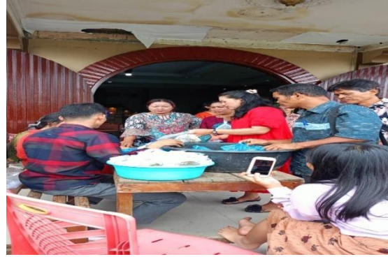
Gambar 8. Bakti Sosial dalam Kegiatan Bazar di Gereja GBKP Desa Sugau