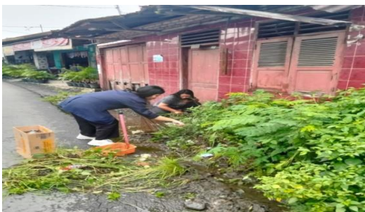
Gambar 7. Kegiatan Gotong Royong Bersama Penduduk Dusun 2.