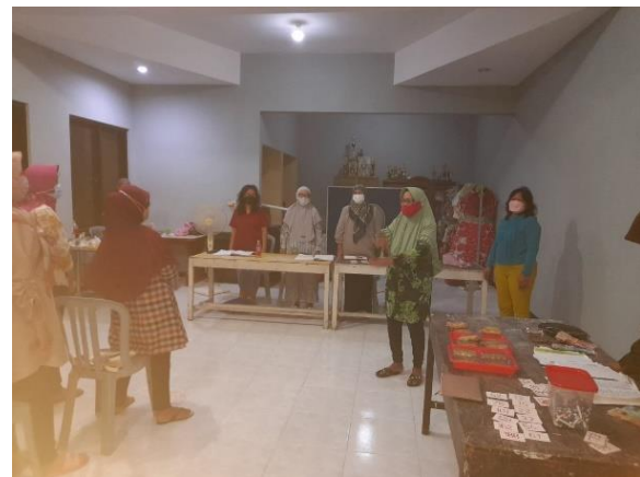
Gambar 7. Penyuluhan pemahaman proses produksi keripik ikan

masa panennya sesuai dengan jenis ikan. Kemudian diambil ikan yang sudah layak panen dengan kondisi yang sehat dan dilanjutkan tahap pembersihan sisik pada kulit ikan. Setelah proses pembersihan sisik kulit ikan selesai dilanjutkan pada pemisahan bagian-bagian ikan dimana yang akan dipakai yaitu kulit dan daging ikan. Lalu dilanjutkan pada penggorengan ikan hingga kering dan apabila sudah sampai pada tingkat kematangan dan kering yang sesuai, daging dan kulit ikan kemudian ditiriskan. Dalam tahap pentirisan tersebut dilakukan pemisahan dan pemilihan antara daging dan kulit ikan karena kedua bagian ikan tersebut akan menjadi dua jenis produksi yang berbeda. Dimana hasil yang akan diproduksi oleh warga bersama dengan tim pengabdian kepada masyarakat adalah keripik ikan dan keripik kulit ikan. Sebagai tahap akhir dari proses produksi ini dilakukan pengemasan yang rapi dengan menggunakan plastik klip dan pembuatan logo produksi sebagai hasil UMKM warga.