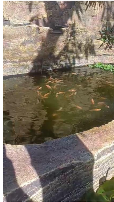
Gambar 3. Kolam ikan dinding bata

dilingkungan Perumahan Babatan Pilang RT. 002.