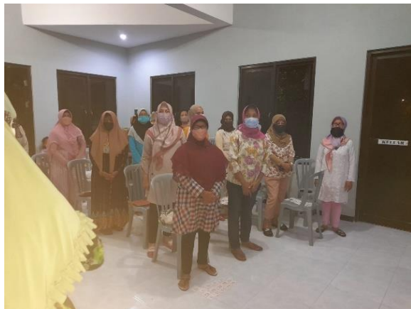
Gambar 6. Penyuluhan edukasi enterpreunership kepada warga

Enterpreunership membuka peluang usaha yang sangat besar bagi warga yang tinggal di Perumahan Babatan Pilang RT. 002 untuk dapat membantu sesama warga sekitar yang membutuhkan pekerjaan. Disamping itu dengan menjadi seorang enterpreuner mampu memberikan pendapatan tambahan baik itu sebagai passive income atau active income . Besarnya inflasi yang terjadi hampir di seluruh negara di dunia membuat perilaku manusia harus berubah, aktif dalam membuka usaha menjadi sebuah peluang yang sangat bagus untuk memenuhi kebutuhan hidup sehari-hari. Nilai pengeluaran yang semakin besar menuntut pendapatan juga harus seimbang sebagai penghasilan setiap bulannya.