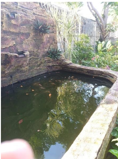
Gambar 4. Penaburan bibit ikan nila

Pembudidayaan ikan lele dan ikan nila juga melibatkan warga masyarakat sekitar serta para pekerja lapangan dalam proses pembangunannya. Sehingga adanya kerja sama secara gotong royong dapat meningkatkan jiwa sosial antar warga. Selain penempatan dan pembuatan kolam ikan juga dilakukan pembuatan sistem filter air yang berfungsi untuk menjernihkan air dan memproduksi oksigen dalam air. Untuk usia