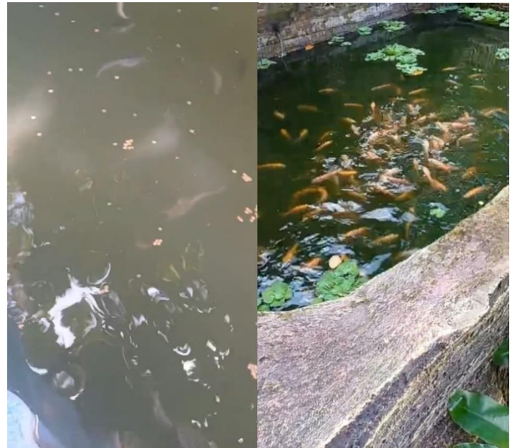
Gambar 5. Penaburan bibit ikan lele

panen ikan lele sendiri membutuhkan waktu sekitar 3-4 bulan sementara untuk masa panen ikan nila membutuhkan waktu 4-6 bulan. Semua proses panen tersebut juga diperhitungkan dari cara dan jenis makanan yang diberikan ke ikan. Semakin baik jenis makanan yang diberikan akan lebih cepat dan baik hasil panen yang dihasilkan. Dalam proses pembudidayaan ini diberlakukan sistem piket mingguan untuk memberi makan ikan dan proses kuras kolam agar tetap terjaga kebersihannya. Proses pengurasan kolam ikan dapat dilakukan dalam kurun waktu 1 kali dalam 1 bulan.