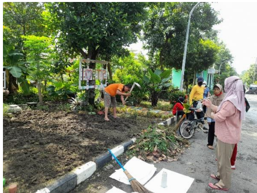
Gambar 2. Pembersihan dan pemerataan lahan untuk pembuatan kolam ikan

Kegiatan pengabdian kepada masyarakat di lingkungan Perumahan Babatan Pilang RT. 002 berangkat dari permasalahan warga ( problem solving ) yang menginginkan adanya pelatihan untuk meningkatkan dan menumbuhkan semangat enterpreunership . Secara garis besar banyak warga masyarakat yang tinggal di wilayah tersebut sudah tergolong sebagai pensiunan atau tidak bekerja lagi. Persaingan bisnis di sekitar tempat tinggal warga semakin banyak dimana jenis usaha yang didirikan yakni membuka toko kelontong di area teras dari masing-masing rumah. Sehingga perlu adanya penyuluhan dalam bentuk pemberian edukasi dalam menciptakan usaha sendiri untuk menjadi seorang wiraswasta agar tidak memiliki jenis usaha yang sama di satu lingkungan yang sama. Hal ini dimaksudkan untuk tidak menciptakan persaingan usaha yang sama dan menjadi bentuk usaha baru