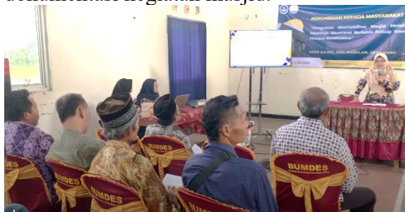
Gambar 4. Penyampaian Materi dan Simulasi

Setelah serangkaian acara pembukaan, kegiatan dilanjutkan dengan penyampaian materi yang mencakup konsep dasar tata kelola masjid yang baik, simulasi pencatatan keuangan yang akurat, serta praktik langsung penggunaan platform digital untuk mendukung transparansi dan akuntabilitas. Selama pelatihan, peserta terlibat aktif dalam diskusi dan latihan pengisian format laporan keuangan serta dokumentasi kegiatan masjid.