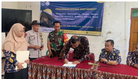
Gambar 3. Pembukaan dan penandatanganan Institutional Agreement (IA)

Tahap pelaksanaan pelatihan dan pendampingan dalam program pengabdian ini dilaksanakan secara intensif melalui rangkaian kegiatan terstruktur, dimulai dengan sesi pembukaan resmi yang dihadiri oleh pengurus masjid dan tim pelaksana pengabdian. Pada sesi ini juga dilakukan penandatanganan Institutional Agreement (IA) sebagai bentuk komitmen bersama untuk mengimplementasikan prinsip Good Mosque Governance secara berkelanjutan.