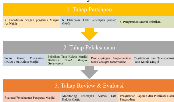
Gambar 1. Metode Pelaksanaan Pengabdian

Tahap ini bertujuan untuk memastikan efektivitas implementasi sistem Good Mosque Governance dalam tata kelola masjid serta memberikan rekomendasi untuk keberlanjutan program. Kegiatan yang dilakukan meliputi evaluasi pemahaman pengurus masjid serta monitoring penerapan sistem tata kelola masjid.