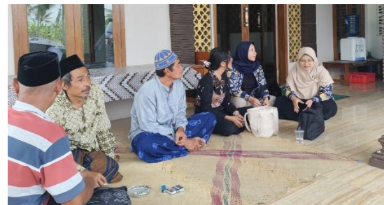
Gambar 2. Koordinasi Dengan Pengurus Masjid.

Pada tahap ini, tim pengabdian melakukan koordinasi awal dengan pengurus masjid. Pengurus menunjukkan antusiasme tinggi terhadap pentingnya penerapan tata kelola modern sebagai upaya meningkatkan akuntabilitas dan kepercayaan jamaah terhadap pengelolaan masjid. Kegiatan koordinasi ini juga menjadi dasar dalam penyusunan modul penguatan akuntabilitas masjid berbasis Good Mosque Governance . Modul ini memuat lima prinsip utama: transparansi, akuntabilitas, partisipasi jamaah, efektivitas program, dan keberlanjutan kelembagaan.