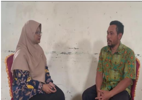
Gambar 6. Testimoni Pegurus Masjid

Tahap ini bertujuan untuk memastikan sejauh mana pemahaman dan keterampilan pengurus dalam menerapkan prinsip-prinsip yang telah diberikan. Pengurus menunjukkan kemampuan menyusun laporan sederhana berbasis prinsip Good Mosque Governance secara mandiri dan menyatakan kesiapannya untuk melanjutkan praktik tata kelola secara berkelanjutan.