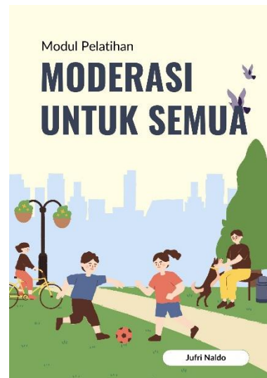
Gambar II. Pelaksanaan Pengabdian

siswa menyatakan bahwa mereka memahami makna wasathiyah dan 75% menyatakan siap berinteraksi dengan teman dari latar belakang yang berbeda secara lebih terbuka dan damai.