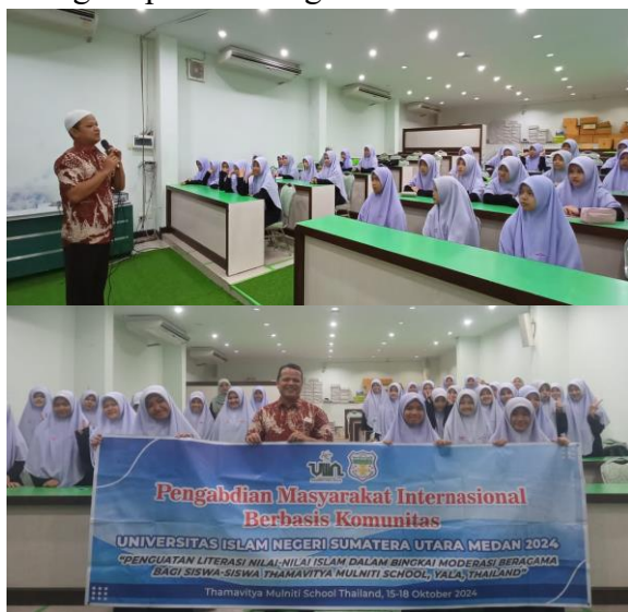
Gambar II. Pelaksanaan Pengabdian

Evaluasi atau monitoring pascapelaksanaan dilakukan melalui post-test yang disusun serupa dengan instrumen pre-test. Hasilnya menunjukkan adanya peningkatan signifikan dalam pemahaman konsep moderasi beragama. Sebanyak 82%