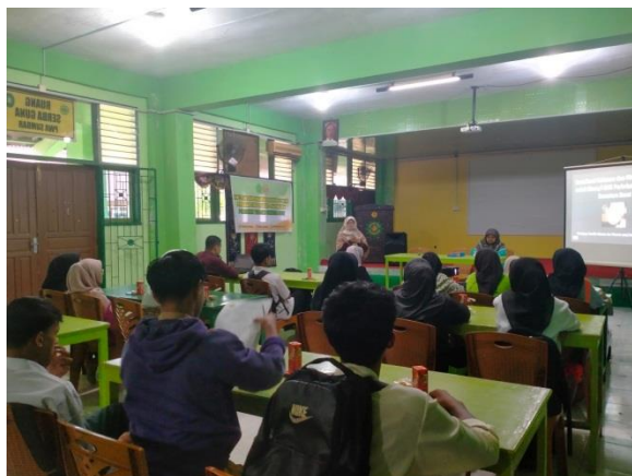
Gambar 5. Paparan Materi Dari Tim PkM