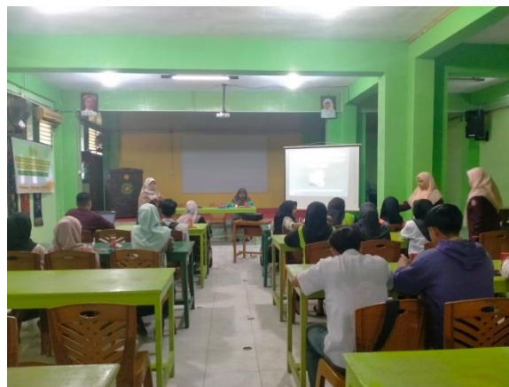
Gambar 6. Siswa/i Antusias Tanya Jawab dan Menyampaikan Pendapat

Pada paparan materi tim PkM menampilkan beberapa Foto dan meyampaikan pentingnya kita sebagai umat muslim cerdas dalam memilah makanan dan minuman halal yang akan kita konsumsi serta memaparkan beberapa kasus tentang produk halal dan tidak halal. Selanjutnya tim PkM melakukan diskusi terbuka dengan para siswa/i, kepala sekolah, guru dan pegawai. Pada diskusi ini siswa/i sangat antusias dalam bertanya dan mengemukakan argumen mereka terkait makanan dan minuman halal yang marak terjadi saat ini. Berdasarkan pertanyaan dan argumen siswa/i tim PkM dapat mengetahui dan mengkaji pengetahuan dan wawasan siswa/i tentang makanan dan minuman halal sesudah mereka diberikan materi dan sosialisasi dilakukan.