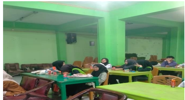
Gambar 4. Siswa/i melakukan interaksi aktif mengenai makanan dan minuman halal

Kegiatan selanjutnya dilakukan interaksi antar siswa/i untuk mengetahui pengetahuan dan wawasan mereka sejauh mana mengetahui tentang makanan dan minuman halal.