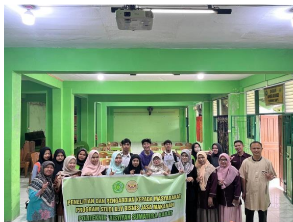
Gambar 7. Foto Bersama Tim PkM

Berdasarkan hasil evaluasi tersebut rata-rata pengetahuan dan wawasan siswa/i berada pada rentang 85% - 95% termasuk kedalam kategori terampil. Selain itu dilihat dari antusiasme siswa/i sangat tinggi dan siswa/i sudah mulai mengetahui pentingnya makanan dan minuman halal, contoh produk dan bagaimana tips dalam memilih produk yang halal untuk dikonsumsi.