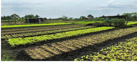
Gambar 1. Potensi Tanaman Sayuran di Lahan Gambut