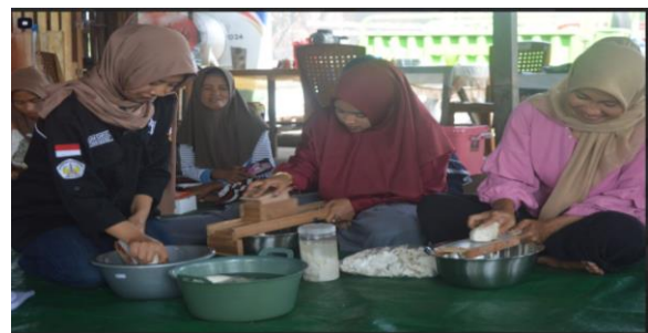
Gambar 4. Pelatihan Pembuatan Tepung Mocaf

Kegiatan ini memberikan keterampilan baru kepada masyarakat tani dalam mengolah ubi kayu menjadi produk olahan bernilai tambah. Peserta dilatih mulai dari proses pemilihan bahan baku, fermentasi, pengeringan, hingga penggilingan menjadi tepung mocaf. Hasil praktik menunjukkan bahwa masyarakat mampu menghasilkan tepung mocaf berkualitas baik yang berpotensi digunakan sebagai bahan substitusi tepung terigu (Sarasi et al., 2025)(Unayah et al., 2020). Dengan adanya keterampilan ini, masyarakat tani tidak hanya dapat mengurangi ketergantungan pada pasar segar, tetapi juga mampu menciptakan diversifikasi produk pangan yang lebih berkelanjutan. Produk olahan ini diharapkan dapat membuka peluang usaha baru serta meningkatkan pendapatan rumah tangga petani.