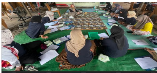
Gambar 5. Pelatihan Pencatatan Keuangan

Pelatihan ini memberikan pemahaman dasar kepada peserta mengenai pentingnya pencatatan arus kas masuk dan keluar dalam usaha tani. Peserta diperkenalkan pada format pencatatan sederhana yang mudah diaplikasikan, meliputi pencatatan biaya produksi, hasil penjualan, serta keuntungan yang diperoleh. Hasil kegiatan menunjukkan bahwa masyarakat mampu menyusun laporan keuangan sederhana, yang akan mempermudah mereka dalam mengambil keputusan usaha, mengakses permodalan, serta merencanakan keuangan bagi usahanya (Hidayat & Raganata, 2022)(Kurniati et al., 2020).