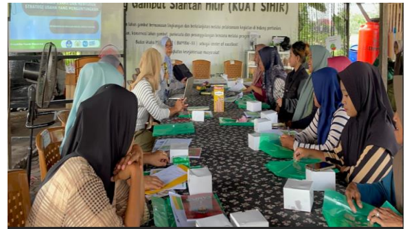
Gambar 3. Pelatihan Pemetaan Bisnis

Pelatihan ini berhasil meningkatkan pemahaman peserta mengenai bagaimana merancang strategi usaha secara lebih terarah. Masyarakat tani diperkenalkan pada sembilan elemen utama dalam Business Model Canvas (BMC) seperti segmen pelanggan, proposisi nilai, saluran distribusi, serta struktur biaya dan pendapatan. Melalui praktik langsung, peserta mampu memetakan potensi usaha berbasis sayuran dan usaha UMKM pengolahan hasil sayuran, sehingga memiliki gambaran yang lebih jelas tentang peluang pasar dan strategi pengembangan usaha (Lichy et al., 2025)(Murray & Scuotto, 2015). Dengan adanya kegiatan ini, masyarakat tani mulai memahami pentingnya perencanaan usaha dan inovasi produk untuk meningkatkan daya saing.