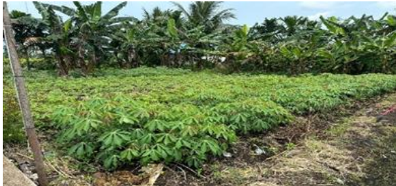
Gambar 2. Potensi Tanaman Ubi Kayu di Lahan Gambut

Permasalahan utama yang dihadapi oleh masyarakat tani di Kampung Gambut meliputi: a. Kemampuan manajemen usaha yang masih terbatas terutama dalam menyusun pencatatan keuangan dan memetakan usaha untuk merumuskan strategi usaha yang tepat, b. Keterbatasan iptek pertanian dalam meningkatkan kesuburan tanah gambut, dimana hasil masih kurang efektif dalam mengatasi sifat asam dan rendahnya unsur hara pada tanah gambut. Penggunaan teknologi pertanian ramah lingkungan, seperti pupuk organik dapat meningkatkan produktivitas di lahan gambut hingga 20% (Rosadi et al., 2020). Dampak Lingkungan dimana pengolahan lahan gambut yang tidak ramah lingkungan dapat menyebabkan emisi gas rumah kaca dan degradasi lahan, yang berpotensi memperburuk perubahan iklim. Pertanian berkelanjutan menjadi kebutuhan bagi perbaikan sistem pertanian di Indonesia untuk mewujudkan ketahanan pangan yang berdampak bagi ekologi, ekonomi dan sosial masyarakat. c. Diversifikasi pangan dari olahan ubi kayu yang masih sangat kurang. Padahal ubi kayu berpotensi besar untuk