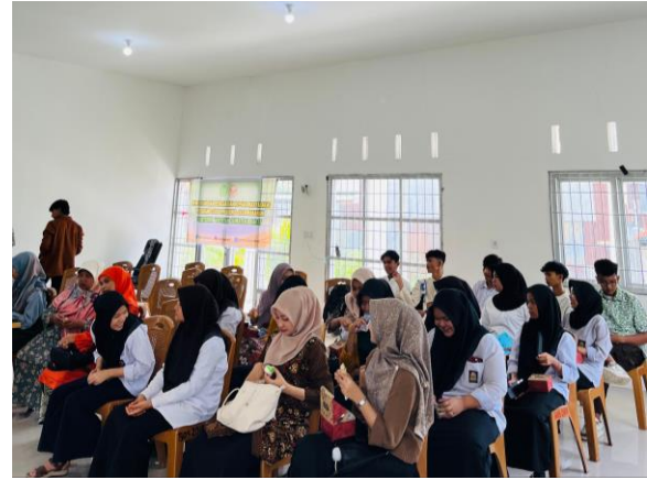
Gambar 6. Siswa/i Antusias Pratek Rileksasi dan Tanya Jawab

Setelah dilakukan kegiatan edukasi terakhir dilakukan tahapan evaluasi. Tahapan evaluasi dilihat dari interaksi aktif peserta PkM, dalam melakukan praktek rileksasi dan mengajukan pertanyaan yang diajukan dan diskusi yang dilakukan secara bersama siswa/i.