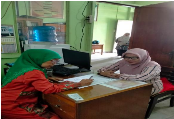
Gambar 1. Penandatanganan Surat Kesediaan Mitra

Pada tahap persiapan dimulai dari pengurusan surat kesediaan dari mitra dalam hal ini SMK Pariwisata Aisyiyah Sumatera Barat