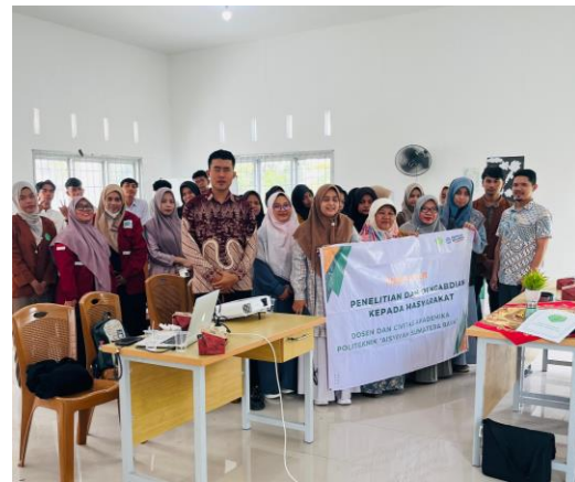
Gambar 7. Foto Bersama Tim PkM

Berdasarkan hasil evaluasi tersebut rata-rata pengetahuan dan wawasan siswa/i berada pada kategori terampil. Selain itu dilihat dari antusiasme siswa/i sangat tinggi dan siswa/i sudah mulai mengetahui apa itu kesehatan mental dan manajemen stres hingga strategi yang dapat dilakukan dalam mengendalikan dan pengelolaan kesehatan mental dan stres pada remaja siswa/i SMK.