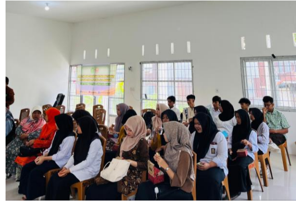
Gambar 4. Siswa/i melakukan interaksi awal

Kegiatan selanjutnya dilakukan interaksi awal antar siswa/i untuk melihat sejauh mana pengetahuan dan wawasan mereka tentang kesehatan mental dan manajemen stres.