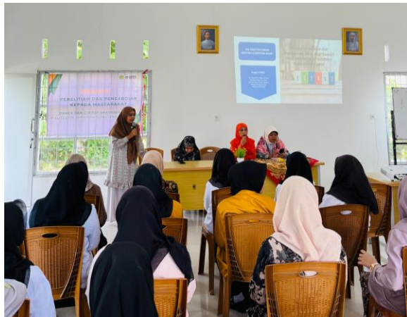
Gambar 3. Kata Sambutan Dari Ketua PkM

kesempatan ini beliau memantik dengan pertanyaan apakah siswa/i apakah sudah mengetahui apa itu kesehatan mental dan manajemen stres? serentak siswa/i menjawab kalau mereka telah mengetahui, akan tetapi saat ditanya apakah mengetahui bagaimana pengelolaannya, siswa/i menjawab kalau mereka tidak mengetahui bagaimana cara pengelolaan kesehatan mental dan manajemen stres tersebut. Pada kesempatan ini ketua tim menyampaikan bahwa melalui kegiatan ini, Tim PkM ingin memberikan pengetahuan dan keterampilan praktis agar siswa mampu menghadapi tekanan akademik dan dunia kerja dengan cara yang sehat dan adaptif serta harapan beliau kegiatan ini menjadi langkah awal dalam menciptakan generasi yang tangguh secara mental, memiliki daya juang tinggi, dan mampu mencapai potensi terbaiknya.