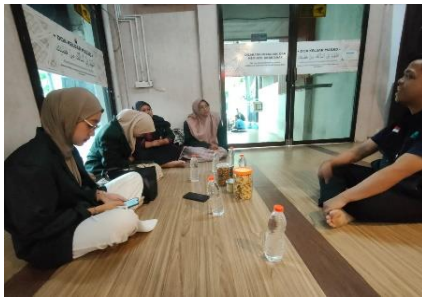
Gambar 2. Diskusi Mendorong Kebiasaan Positif di Masjid

Hal ini tidak hanya mendorong mereka untuk beribadah tetapi juga dapat menciptakan kebiasaan positif untuk yang datang ke masjid secara rutin. Dengan cara ini masjid tersebut berfungsi sebagai tempat yang tidak hanya menyediakan makanan, tetapi juga sebagai pusat spiritual yang mengajak para pemuda untuk lebih mendalami agama.