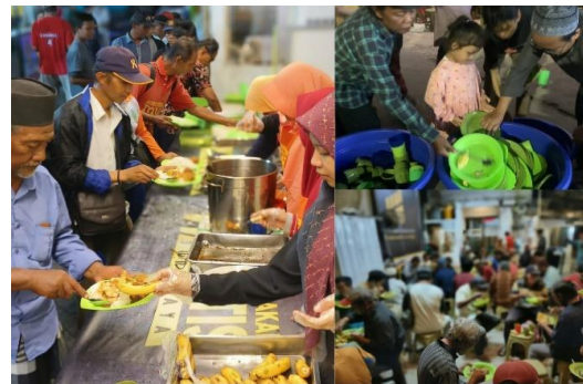
Gambar 10. Pemuda Masjid Mendukung Program Makan Gratis