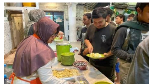
Gambar 1. Persentase Program Makan Gratis