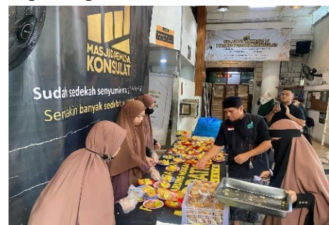
Gambar 4. Pemuda Masjid Membuat Konten Promosi Program Makan Gratis