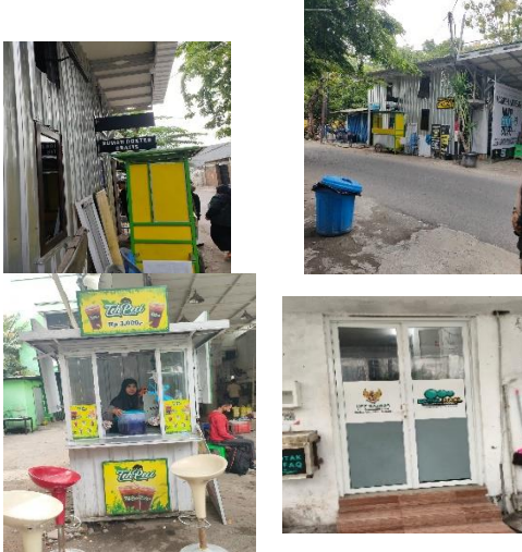
Gambar 5. Pemuda Beraktivitas Di Masjid Dengan Fasilitas Nyaman Dan Ramah

dan nyaman ini menjadi daya Tarik tersendiri bagi pemuda untuk datang ke masjid. Selain itu, masjid juga mendukung kegiatan lain seperti TPQ yang dapat melibatkan pemuda sebagai pengajar. Ini dapat memberikan mereka kesempatan untuk berkontribusi dalam Pendidikan generasi muda.