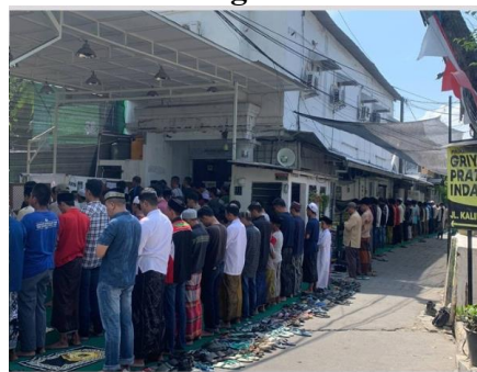
Gambar 7. Masyarakat Solat Berjamaah di Masjid

(Halimah, N. 2020) menjelaskan bahwa tata ruang masjid sangat mempengaruhi kenyamanan dan keterlibatan jamaah. Faktor penghambatnya itu dalam operasional masjid ini, terutama pada pengondisian jumlah jamaah yang setiap harinya semakin meningkat. Karena lokasinya terletak di tepi jalan raya, jadi kepadatan jamaah terutama saat sholat jumat sering kali menyebabkan kemacetan. Jadi untuk mengatasi keterbatasan ruang, masjid ini terpaksa meminjam sebagian area parkir dari minimarket di samping masjid, dan menutup jalan untuk digunakan sebagai tempat sholat tambahan.