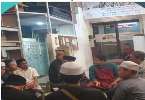
Gambar 8. Diskusi Peningkatan Kegiatan Keagamaan Dengan Ikatan Remaja Masjid

Keterlibatan Ikatan Remaja Masjid dalam meningkatkan aktivitas keagamaan tidak bisa dilepaskan dari kontribusi ide-ide yang mereka berikan. Hal ini sejalan dengan pendapat (Syamsi, 2014) yang menyatakan bahwa partisipasi juga dapat berupa pemikiran, seperti saran dan masukan terhadap program kegiatan. Beragam gagasan telah diajukan oleh Ikatan Remaja Masjid guna mendukung peningkatan kegiatan keagamaan di tengah Masyarakat