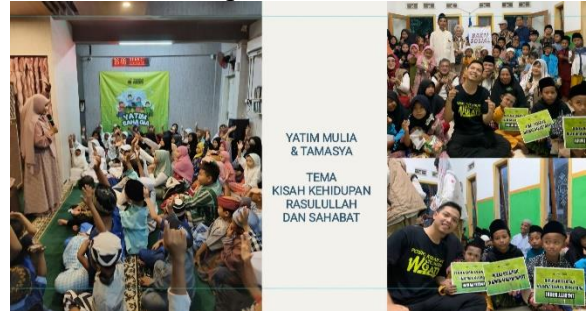
Gambar 9. Kegiatan Program Makan Gratis Yang Dijalankan Di Masjid Bersama Anak-Anak

Dalam Islam, karakter dan akhlak yang baik itu sangat penting. Belajar agama nggak cuma soal hafalan atau ibadah ritual, tapi juga bagaimana kita bersikap ke sesama. Salah satu nilai yang paling ditekankan adalah empati peka terhadap kondisi orang lain dan mau membantu tanpa pamrih. Program makan gratis yang dijalankan di masjid menjadi salah satu metode efektif dalam menanamkan nilai-nilai empati secara aplikatif. Melalui kegiatan ini, pemuda tidak hanya melihat penderitaan orang lain dari kejauhan, tetapi juga terlibat secara langsung dalam membantu sesama. Mereka belajar menyisihkan waktu, tenaga, dan bahkan uang sakunya untuk berbagi kepada jamaah yang membutuhkan (Salwa, 2022) .