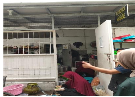
Gambar 3. Para Pemuda Sedang Bergotong Royong Menyiapkan Dan Membagikan Makanan Gratis