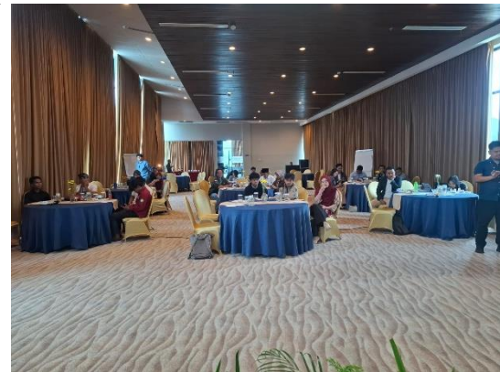
Gambar 2. Diskusi Peran Negara dan Kewajiban Pemerintah Daerah dalam Perlindungan PMI

daerah, telah diimplementasikan di NTB. Diskusi ini berhasil mengidentifikasi adanya kesenjangan antara mandat hukum yang ideal dengan praktik di lapangan. Para peserta dari SBMI dan komunitas PMI menyuarakan pengalaman mereka tentang sulitnya mengakses layanan pemerintah, sementara perwakilan pemerintah daerah memberikan perspektif mengenai tantangan internal yang mereka hadapi, seperti keterbatasan anggaran dan sumber daya manusia. Sesi ini menjadi jembatan penting untuk memahami bahwa perlindungan PMI bukan hanya tanggung jawab satu institusi, melainkan sebuah ekosistem yang membutuhkan sinergi multi-pihak.