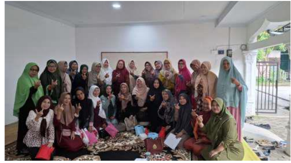
Gambar 3. Dokumentasi Pelaksanaan Kegiatan

Penelitian ini bertujuan untuk meningkatkan literasi keuangan syariah guna mencegah penipuan investasi dan pinjaman online di Kelompok Pengajian Nurul Iman, Kelurahan Gedung Johor, Kota Medan. Hasil pre-test dan post -test menunjukkan peningkatan pemahaman peserta sebesar 50% dari rata – rata skor 48 menjadi 72. Hal ini sejalan dengan teori literasi keuangan yang menyatakan bahwa peningkatan pengetahuan finansial dapat mengubah perilaku keuangan