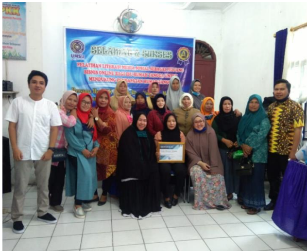
Foto Kegiatan PKM