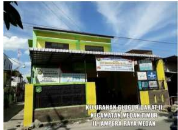
Gambar 2. : Kantor Kelurahan glugur darat