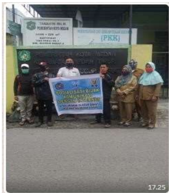
Gambar 1 : tempat kegiatan sosialisasi

Evaluasi kegiatan program pengabdian kepada masyarakat. Pertama yang dilakukan dalam kegiatan ini berkomunikasi dengan masyarakat dan kelurahan glugur darat medan, kedua persiapan melakukan sosialisasi dengan mengumpulkan masyarakat, ketiga melakukan kegiatan sosialisasi dengan memberikan penyuluhan bahwa penggunaan internet harus bijak sebab akan menimbulkan dampak negatif apabila tidak dimanfaatkan secara cerdas dan yang keempat bahwa perguruan tinggi tetap melakukan pembinaan dan pendampingan pada masyarakat sehingga masyarakat bijak dalam menggunakan media komunikasi internet.