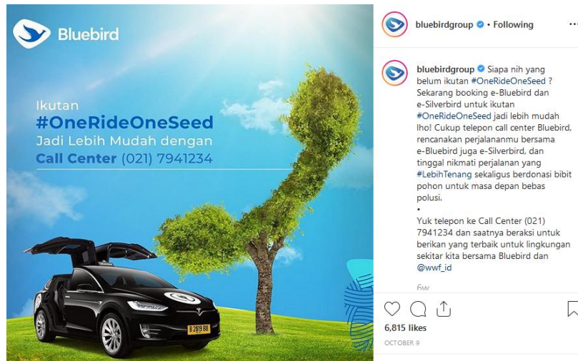
Gambar 5. Postingan strategi scarcity

Program One Ride One Seed diadakan selama 3 bulan mulai 1 Agustus hingga 31 Oktober 2019, yang mana hal tersebut masuk ke dalam time Scarcity , namun di dalam konten instagram @bluebirdgroup tidak menjelaskan keterbatasan waktu program One Ride One Seed . Dalam postingan yang menggunakan strategi Scarcity , hanya menampilkan suatu produk yang eksklusif dan limited edition yaitu sebuah mobil listrik Tesla Model X 75 D.