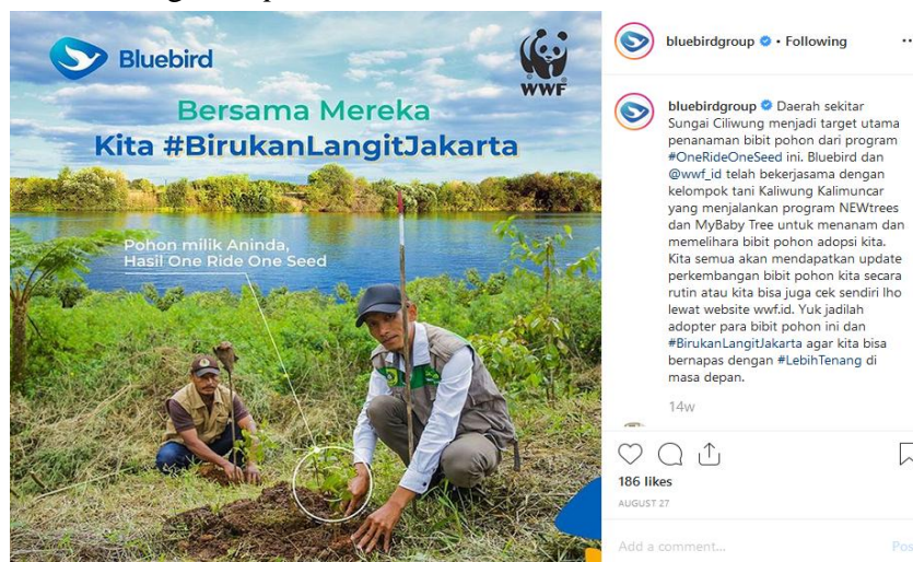
Gambar 1. Postingan strategi reciprocation ( Sumber : Instagram @Bluebirdgroup)

Berdasarkan hasil analisis pada tabel 4 diatas, menunjukkan bahwa data yang didapatkan melalui pengukuran lembar koding dari kedua pengkoder, terdapat 60 strategi pesan persuasif yang memiliki nilai kesepakatan yang sama terkait konten Instagram @Bluebirdgroup pada program One Ride One Seed . Dari enam strategi pesan persuasif, terdapat strategi Reciprocation /hukum timbal balik yang memiliki frekuensi terbesar yaitu sebanyak 33 frekuensi dengan presentase 55%. Secara keseluruhan, strategi Reciprocation terlihat dari gambar, vidio dan caption menunjukkan sesuatu yang bermanfaat, yang dapat di berikan oleh bluebird kepada pelanggan sehingga pelanggan akan membalas ( reciprocate ) dengan membeli atau menggunakan produk yang ditawarkan. Berikut ini contoh postingan yang menggunakan strategi Reciprocation :