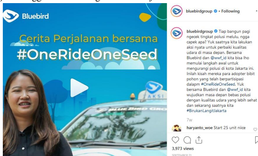
Gambar 4. Postingan strategi social proof

Berdasarkan gambar 3 diatas terlihat pada postingan tersebut, bluebird mengajak masyarakat untuk menunjukkan aksi nyata untuk mengurangi polusi udara dengan mengikuti program One Ride One Seed . Pada bagian caption juga terdapat strategi commitment and consistency pada kalimat “Mulai dari hal yang paling kecil aja dulu, yang bisa kamu lakukan untuk membuat lingkungan sekitar kita jadi lebih baik”. Selanjutnya terdapat strategi Social Proof , mengatakan bahwa individu cenderung lebih mau untuk mengambil suatu tindakan jika individu melihat bukti bahwa orang lain sudah melakukan tindakan tersebut. Berikut ini contoh postingan menggunakan strategi Social Proof :