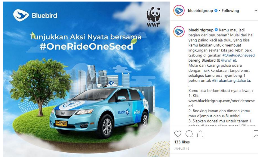
Gambar 3. Postingan strategi commitment and consistency

Berdasarkan gambar 3 diatas terlihat pada postingan tersebut, bluebird mengajak masyarakat untuk menunjukkan aksi nyata untuk mengurangi polusi udara dengan mengikuti program One Ride One Seed . Pada bagian caption juga terdapat strategi commitment and consistency pada kalimat “Mulai dari hal yang paling kecil aja dulu, yang bisa kamu lakukan untuk membuat lingkungan sekitar kita jadi lebih baik”. Selanjutnya terdapat strategi Social Proof , mengatakan bahwa individu cenderung lebih mau untuk mengambil suatu tindakan jika individu melihat bukti bahwa orang lain sudah melakukan tindakan tersebut. Berikut ini contoh postingan menggunakan strategi Social Proof :