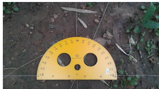
Pengukuran di pemakaman Bânger