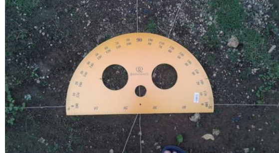
Pengukuran di pemakaman Ajih