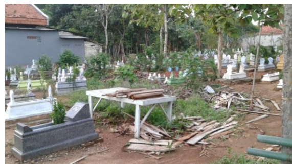
Pemakaman Bânger Dusun Langtolang