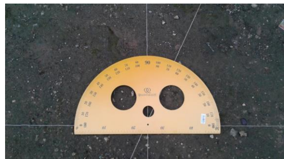
Pengukuran di pemakaman Kaèl

Keempat ; menganalisis akurasi arah kiblat pemakaman dengan menghitung selisih antara garis arah kiblat sesuai perhitungan dengan garis arah kiblat kuburan. Dalam analisis ini penulis menggunakan sampel untuk masing-masing pemakaman sebanyak