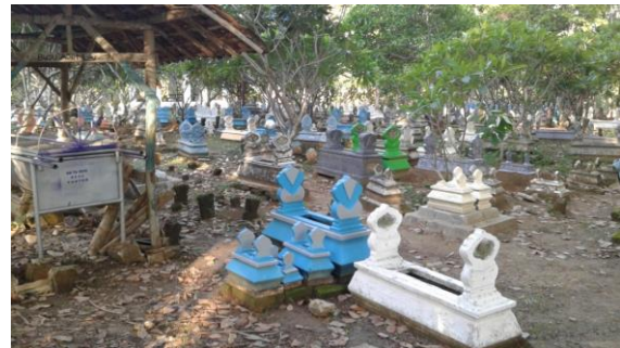
Pemakaman Ajih Dusun Kramat

digunakan sejak zaman belanda atau sebelum Indonesia merdeka. Walaupun keduanya telah digunakan sejak zaman penjajahan Belanda, menurut penuturan informan bahwa yang lebih dulu digunakan adalah pemakaman Ajih. Sementara pemakaman Kaèl yang ada di Dusun Karangpanasan digunakan mulai tahun 1942. Lebih akhir dari dua pemakaman sebelumnya.