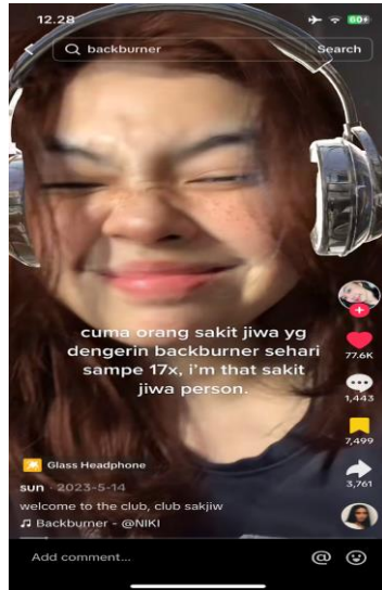
Gambar 1. Musik mempengaruhi emosi