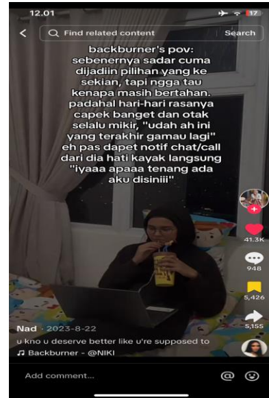
Gambar 2. Perempuan mempresentasikan diri menjadi "Backburner"