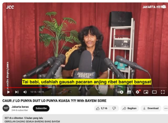
Gambar 1. Cuplikan Video Podcast

sebanyak 327 ribu kali per tanggal 16 Desember 2023.