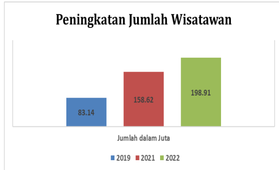
Gambar 1.1. Peningkatan Jumlah Wisatawan Jawa Timur Tiga Tahun Terakhir

wisatawan di Jawa Timur sudah naik lebih dari 200%.