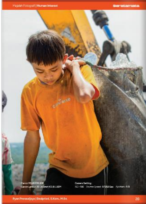
Foto pertama menampilkan seorang anak laki-laki yang mengenakan kaos berwarna oranye dengan kondisi pakaian yang terlihat kotor. Anak tersebut tampak memanggul karung besar di bahu kirinya sambil berjalan di area tempat pembuangan sampah. Posisi tubuh anak terlihat sedikit membungkuk dengan kepala tertunduk. Latar belakang foto memperlihatkan lingkungan tempat pembuangan sampah yang menjadi lokasi aktivitas memulung.