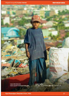
Foto ketiga menampilkan seorang anak laki-laki yang mengenakan kaos biru dan topi karakter. Anak tersebut berdiri tegak sambil memegang karung besar di samping tubuhnya. Latar belakang foto memperlihatkan tumpukan sampah di bagian depan serta area pemukiman kota di bagian belakang. Komposisi visual foto menampilkan kontras antara ruang marginal tempat pembuangan sampah dengan lingkungan perkotaan di sekitarnya.