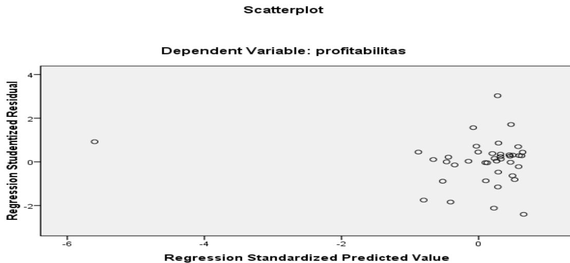
Gambar 3 Grafik Scatterplot

Uji Heteroskedastisitas dilakukan untuk mengetahui apakah dalam sebuah model regresi terjadi ketidaksamaan varians dari residual satu pengamatan ke pengamatan yang lain. Untuk mengetahui apakah terjadi atau tidak terjadi heteroskedastisitas dalam model regresi penelitian ini, analisis yang dilakukan yaitu dengan metode informal. Metode informal dalam pengujian heteroskedastisitas yaitu metode grafik Scatterplot.