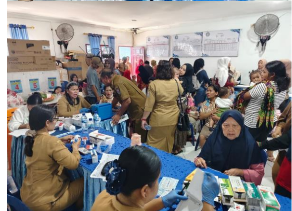
Gambar 2. Penyuluhan Kesehatan

Sosialisasi dan Penyuluhan kesehatan mahasiswa memberikan penyuluhan tentang pentingnya menjaga kebersihan lingkungan, cuci tangan pakai sabun, serta pola hidup sehat. Kegiatan ini mendapat antusiasme dari warga, terutama ibu rumah tangga. Dampak yang terlihat adalah meningkatnya kesadaran warga untuk menjaga lingkungan sekitar, misalnya dengan bergotong royong membersihkan selokan dan halaman rumah.