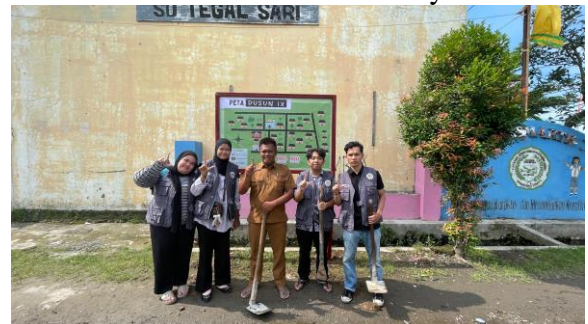
Gambar 5. Pembuatan Peta Desa

Kegiatan gotong royong dilakukan bersama perangkat desa dan masyarakat Desa dusun IX dengan tujuan untuk membersihkan fasilitas umum seperti jalan, masjid, dan lapangan. Selain menciptakan lingkungan yang bersih dan nyaman, kegiatan ini juga mempererat hubungan antara mahasiswa KKN dan masyarakat.