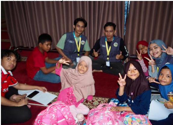
Gambar 1. Kegiatan Mengajar Siswa

Selama pelaksanaan KKN di Desa Laut Dendang Dusun IX, kelompok mahasiswa berhasil merealisasikan beberapa program kerja yang disusun berdasarkan kebutuhan masyarakat.