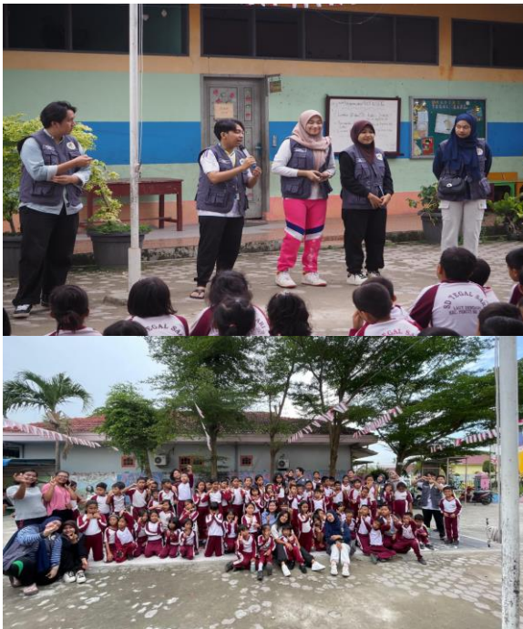
Gambar 3. Edukasi Anti Bullying

Sosialisasi Tentang Bahaya bullying di SD Tegal Sari Desa Laut Dandang dusun IX, kegiatan ini dilaksanakan dengan tujuan memberikan pemahaman pada anak-anak SD Tegal Sari tentang Perbuatan-Perbuatan kecil yang mengandung unsur buliying, dampak buliying terhadap kesehatan mental teman sebaya, sikap yang benar jika menemukan kasus pembuliyian di sekolah serta cara melindungi diri jika mendapatkan buliying secara verbal atau non verbal dari teman sekolah atau lingkungan sekitar.