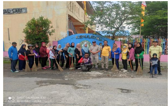
Gambar 4. Gotong Royong Desa

Dampaknya anak-anak SD tegal sari mulai mengerti makna buliying yang sebenarnya bukan hanya berupa tindakan fisik taori juga perkataan dan candaan terselubung yang dapat menyakiti hati teman. Hal ini menjadi poin penting dalam kegiatan KKN dalam rangka menumbuhkan sikap saling menghargai, menjaga solidaritas, saling menghornati sebagai wujud upaya pencegahan beberapa kasus bullying yang terjadi khususnya pada siswa di sekolah.