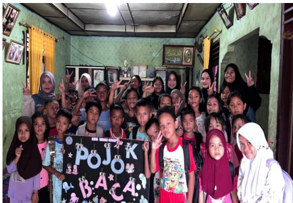
Gambar 2. Dokumentasi Pojok Baca

cerita bergambar dan dongeng menjadi favorit anak-anak, mengindikasikan bahwa minat baca perlu dikembangkan melalui bahan bacaan yang sesuai dengan tingkat usia dan menarik secara visual.