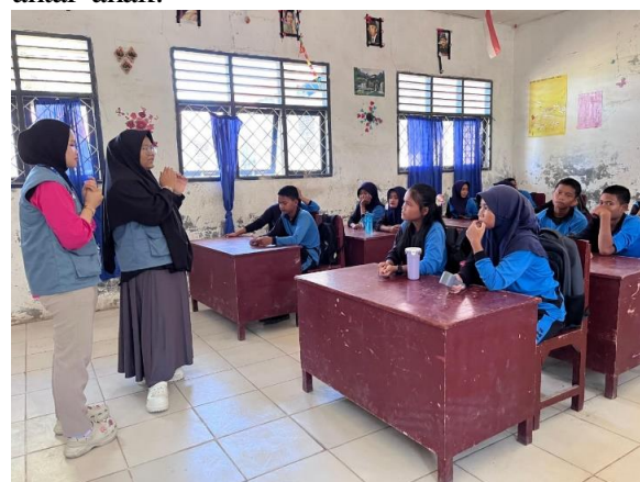
Gambar 3. Dokumentasi Bimbingan Belajar

Faktor pendukung utama keberhasilan program adalah dukungan penuh dari kepala desa yang memberikan izin dan fasilitas posko, kerjasama dengan pihak sekolah, serta antusiasme anak-anak yang tinggi. Namun demikian, terdapat beberapa kendala yang dihadapi meliputi keterbatasan sumber daya berupa buku dan materi ajar berkualitas, fasilitas pendidikan yang minim, faktor ekonomi keluarga yang mempengaruhi partisipasi anak, serta perbedaan kemampuan awal yang signifikan antar anak.