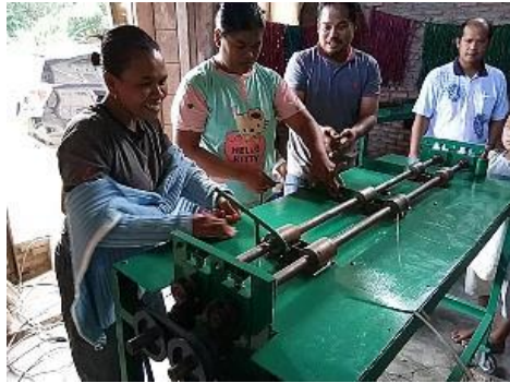
Gambar 6 Pembelahan pandan menggunakan mesin Untuk lebih jelasnya dalam hal pengembangan usaha dan tingkat keberhasilan kegiatan dapat dilihat pada tabel dibawah ini: