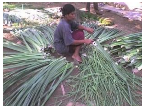
Gambar 5 Pembelahan pandan secara manual

merebus sebanyak 3 kg/ hari dengan alat perebus dan pencampur warna yang terbuat dari stainlesssteel dapat merebus dan mencampurkan warna sebanyak 15 kg/ hari dengan kualitas rebusan yang maksimal serta pewarna sisa rebusan dapat digunakan kembali. Dengan bertambahnya produksi maka berbanding lurus dengan pertambahan pendapatan penjualan yang dilakukan bila ada pesanan dalam jumlah banyak atau partai besar maka UMKM Kerajinan Anyaman Khas Pantai Cermin mampu untuk memenuhinya. Biasanya dalam 1 bulan perkelompok mendapatkan rata-rata omset sebesar Rp. 17.000.000,- setelah diberikan alat teknologi tepat guna terjadi peningkatan sebesar Rp. 26.000.000,- Setiap bulannya. Dan peningkatan pesanan juga semakin bertambah seperti orderan ucapan terima kasih pada pesta pernikahan Bupati Sergai, seminar kit pada seminar nasional sebuah Universitas Besar di kota Medan, seminar kit pada Pelatihan Guru di Dharmas Raya Sumatera Barat, Seminar kit pelatihan guru di Kabupaten Sergai dan masih banyak lagi.